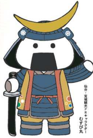
仙台・宮城観光PRキャラクター むすび丸